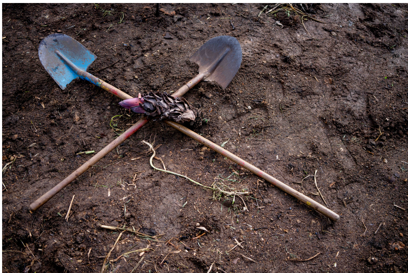
première activation du four a pyrolyse, Ecolieu de Tivoli

Réparer les sols, régénérer les mémoires