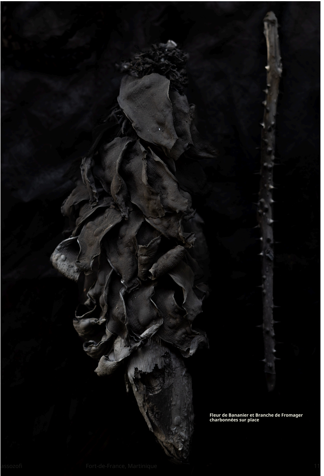
Fleur de Bananier et Branche de Fromager charbonnées sur place